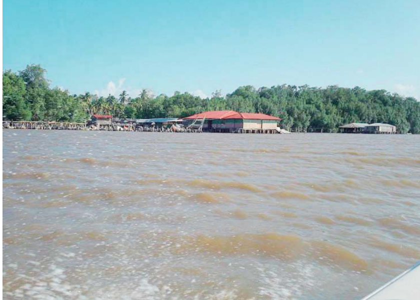
Tras recorrer esta región los visitantes adquirirán una experiencia única e inolvidable.

Otro de los atractivos que tiene la entidad selvática son los Waraos, con 36 mil habitantes, la segunda población indígena más grande de Venezuela. Su cultura y sus vivencias ancestrales, que labran desde sus palafitos, representan la idiosincrasia de este país, privilegiado por la presencia de estos pobladores, quienes despiertan en los visitantes valores y capacidades