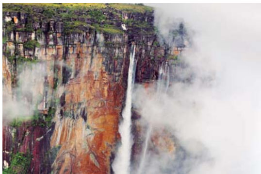
El Ministerio del Poder Popular para el Turismo se sumó a la celebración de esta emblemática fecha.

El año 2017 ha sido declarado por las Naciones Unidas como Año Internacional del Turismo Sostenible para el Desarrollo. Es por ello que la Organización Mundial del Turismo (OMT), elevó el lema "Turismo Sostenible como instrumento para el Desarrollo" y eligió al país Qatar, sede para la celebración del Día Mundial del Turismo, por su ri-