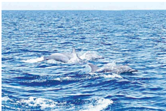
El turismo deportivo se ha convertido en tendencia y ha permitido el desarrollo de nuevos lugares turísticos.

Esta nueva práctica ha consolidado la presencia de importantes competencias de alto rendimiento. Venezuela cuenta con estados priorizados por sus condiciones climatológicas y de terreno. Las costas venezolanas son consideradas de altísima calidad para la exhibición de la disciplina acuática en las modalidades de windsurf, kitesurf, velerismo, kayak. La