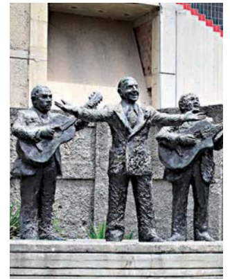
Una plaza y una avenida honran a Gardel en Caño Amarillo.