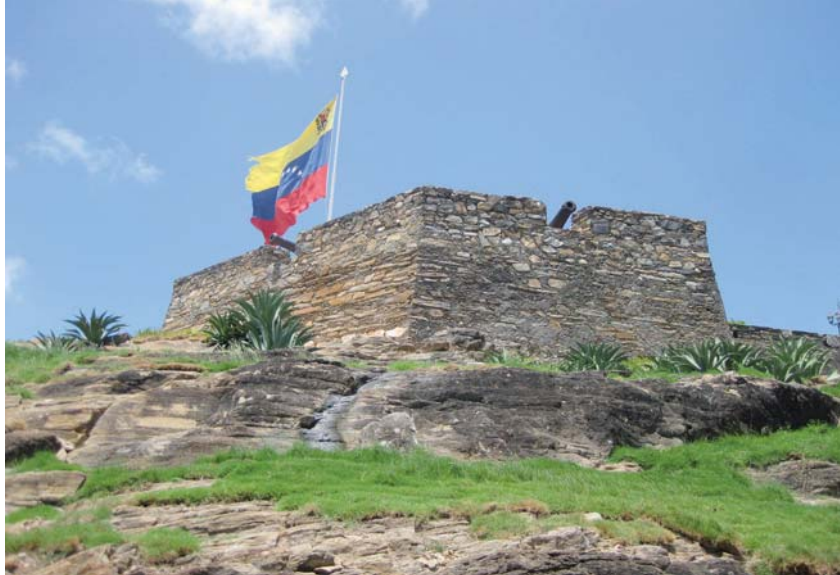
La isla de Margarita invita a visitarla, conocerla y quererla.

Y están las tetas de María Guevara, un excitante lugar con el que nos dotó la naturaleza.