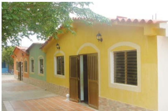
En Robledal, sus pobladores rinden homenaje a Nuestra Señora de Guadalupe.

Como arrodillado a una preciosa ensenada, está este poblado, cuyo nombre proviene del árbol de Roble, y por lo que nos suponemos, no solo le brindó su sombra en tiempos pasados, sino que suministró la madera para muchas de las actividades que se ejecutaban en este poblado.