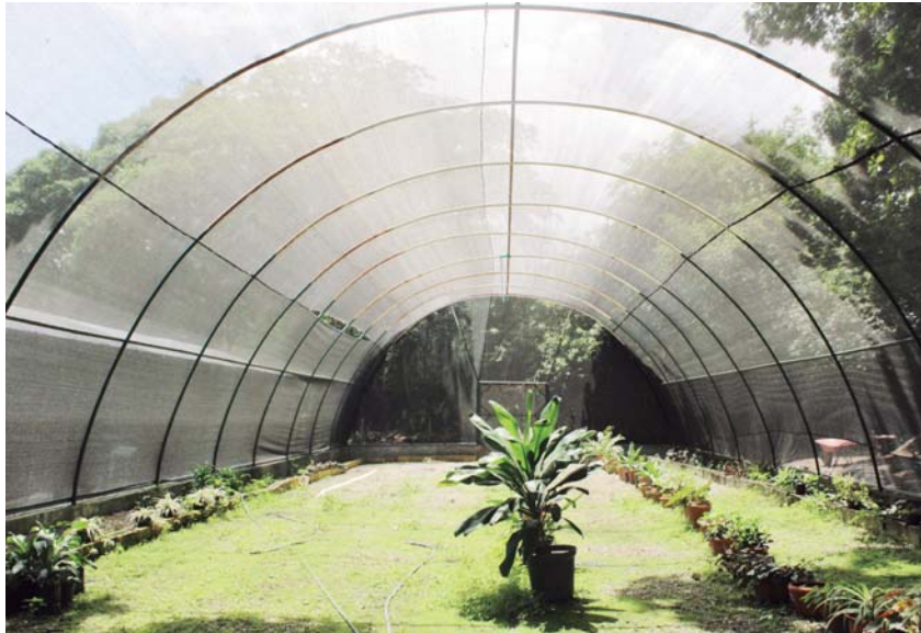
El parque temático vegetal es el principal pulmón vegetal de Barquisimeto.

También posee una hermosa laguna, canchas deportivas, gimnasio, sauna, vivero que resaltan diversas plantas ornamentales, frutales, forestales, medicinales y abonos orgánicos. Sus espacios