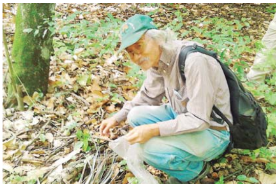
Los espacios del Bosque Macuto se prestan para el turismo recreativo y para la formación a través de diversos programas.

Es por ello que la Fundación Bosque Macuto tiene al servicio de sus visitantes un plan de formación para la cría de especies animales, aprovechamiento en la dieta alimenticia, técnicas de lombricultivo y compost para transformar la