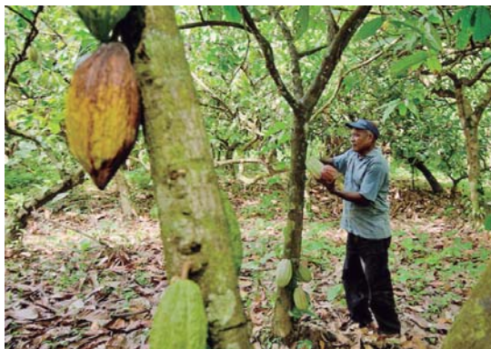
El cacao es el principal cultivo de la población.

Birongo, su nombre significa “medicina tradicional”. Formado por varios caseríos: Birongo Arriba, Birongo Abajo, sus bosques infinitos adornan todos los senderos con un clima caluroso y húmedo. El cacao es su principal cultivo, óptimo para la elabora-