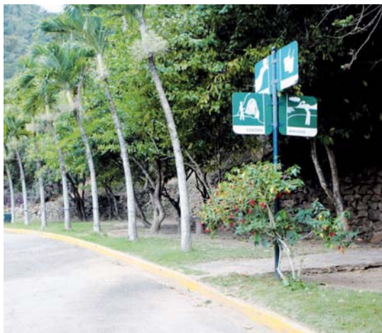
Recorrer la Cueva del Pío es una divertida experiencia turística que jamás olvidarás.

El parque recreacional Cuevas del Indio está ubicado en la zona sureste del valle de Caracas. La autopista Francisco Fajardo, con dirección al este de Caracas, es la mejor opción si vas en vehículo propio para llegar al Parque Nacional. También puedes trasladarte en el sistema de Metro de Caracas hasta la estación Altamira, allí aboradas el Metrobus con destino a El Cafetal. Aledaño al Centro Comercial Plaza Las Américas, se encuentran unas camionetas tipo encava que te conducen hasta el parque. También en el Terminal Río Tuy existe una línea directa a El Cafetal. Al llegar, el visitante cuenta además con un centro de información, sanitarios, estacionamiento y vigilancia.