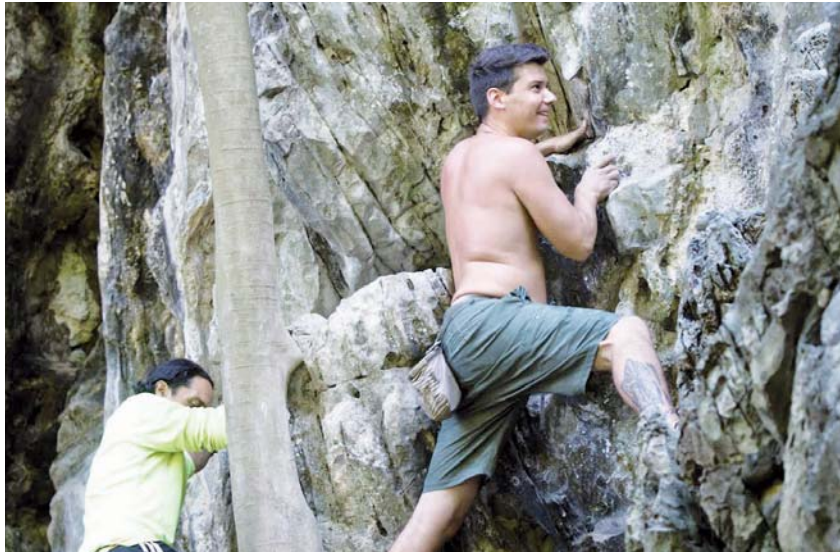
Cuevas del Indio rinde honor al pulmón vegetal ciudadano.

Tras finalizar esta experiencia, te espera una hora de recorrido para visitar la Cueva del Indio -tiene una longitud de 120 metros-. "Extraordinario espacio para escalar y desmontar el mito de que es un deporte elitescos. Los invito a todos a visitar este maravilloso parque que te da opciones para disfrutar de la naturaleza", asegura Federico