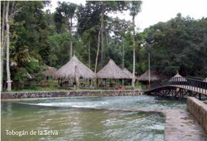
Tobogán de la Selva