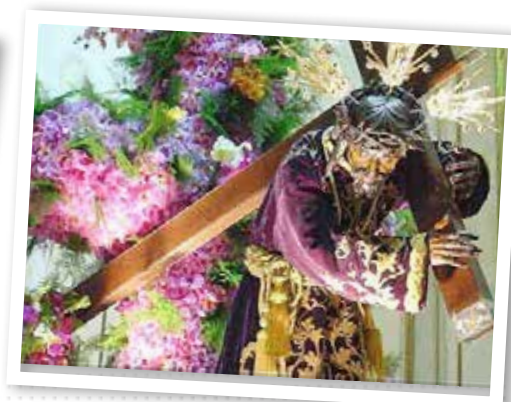
3. Semana Santa