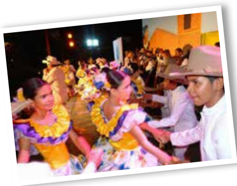
1. Fiestas del Elorza