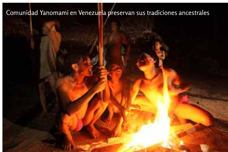
Comunidad Yanomami en Venezuela preservan sus tradiciones ancestrales