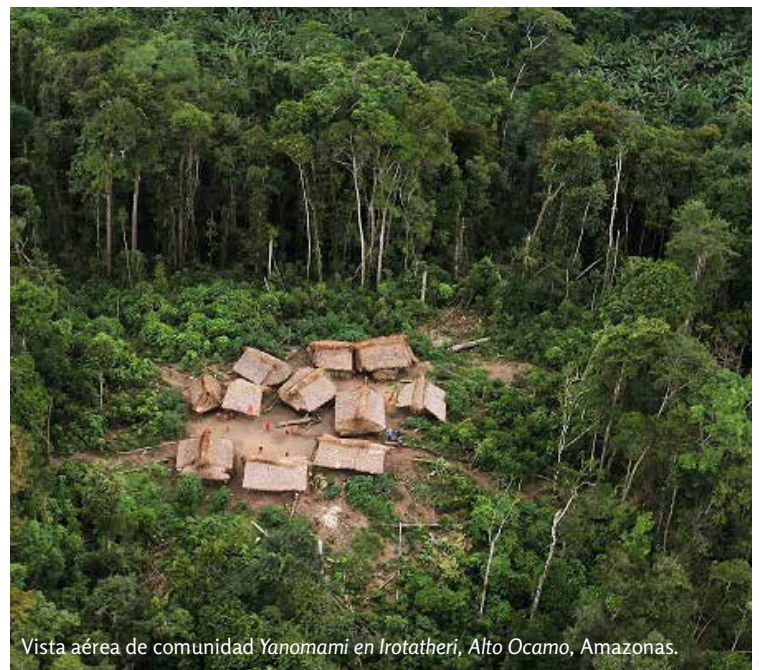
Vista aérea de comunidad Yanomami en Irotatheri, Alto Ocamo, Amazonas.

Las comunidades indígenas arraigadas en la Amazonía venezolana, siempre han sido objeto de admiración y estudio, pues sus procesos de adaptación a las extremas condiciones de la selva les han proveído de alimentos, vivienda, transporte y vestido; sin que por ello hayan intervenido negativamente su entorno natural. Muy por el contrario, la convivencia con la madre naturaleza esta próxima a la perfección.