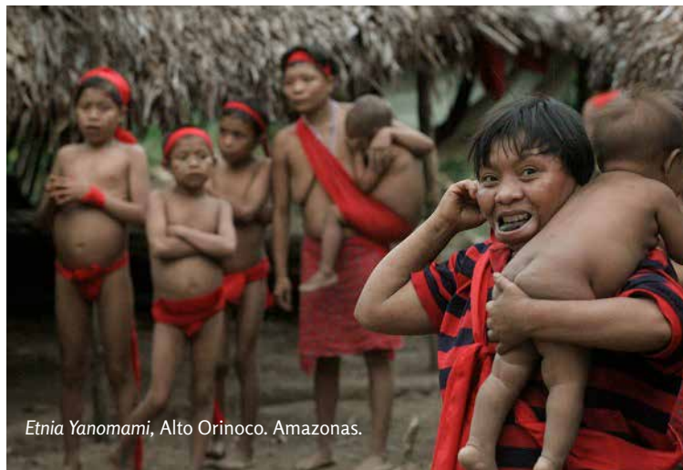
Etnia Yanomami, Alto Orinoco. Amazonas.

La manera para comprender una comunidad indígena, es observar con respeto, sin prejuicios y procurando que todo transcurra como si nunca se hubiese visitado ese entorno, colmado de misticismo, riqueza natural y sobre todo refugio de seres excepcionales, Quienes han cautivado, a través de la historia, a los más connotados exploradores y académicos; demostrando que es posible convivir en armonía con la sabia naturaleza, dejando huellas imborrables a las generaciones futuras con acciones concretos de sostenibilidad y responsabilidad.