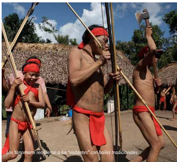
Los Yanomami recibieron a los "visitantes" con bailes tradicionales