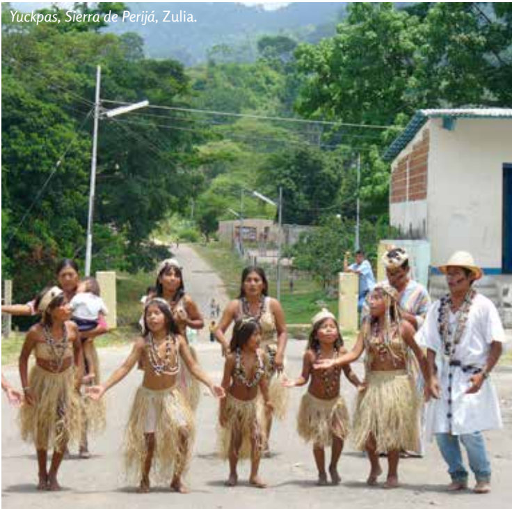
Yuckpas, Sierra de Perijá, Zulia.