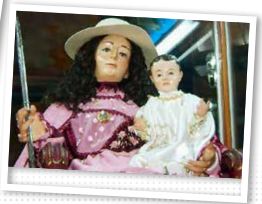
3. Fiestas Patronales de la Virgen de la Divina Pastora