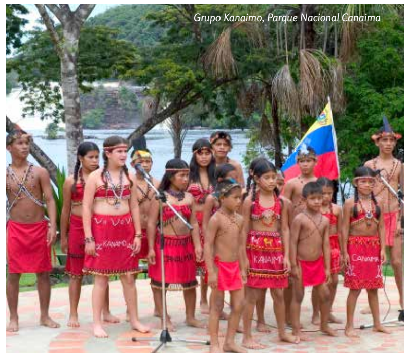
Grupo Kanaimo, Parque Nacional Canaima