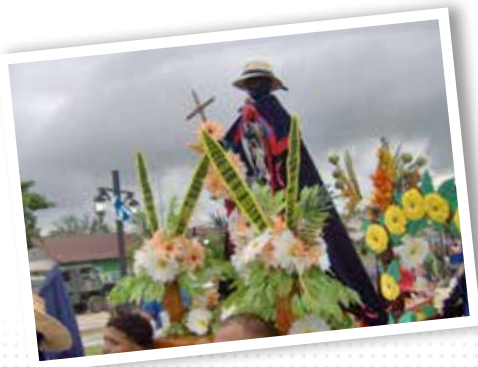
1. Fiestas de San Benito