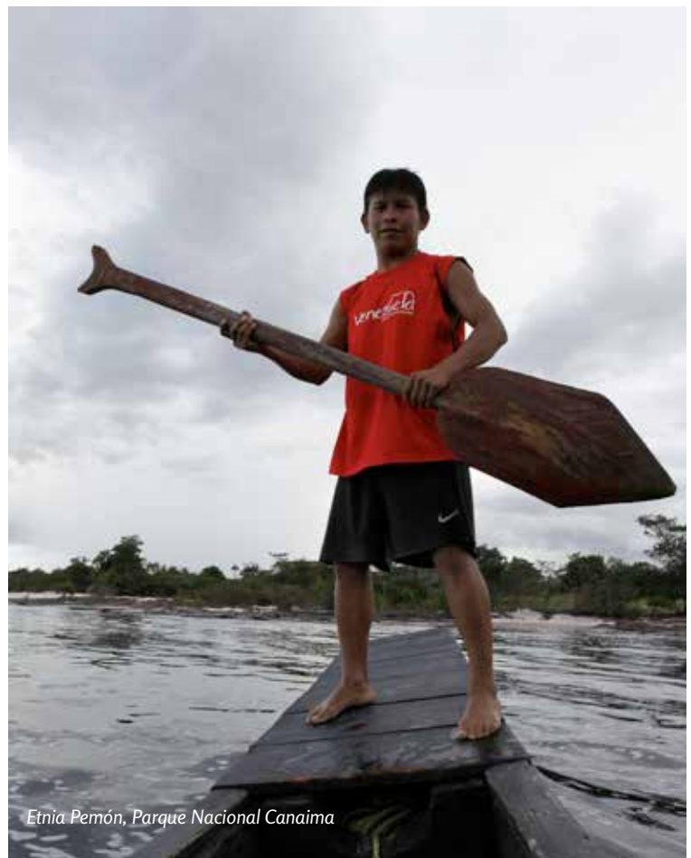
Etnia Pemón, Parque Nacional Canaima