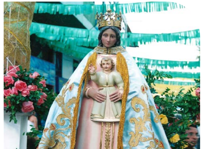
[VIRGEN DE REGLA]

Desde los últimos días de agosto, la Santísima Virgen hace un recorrido por todas las aldeas y sectores de Tovar, con la novena y la Santa Misa, para culminar de manera especial el 8 de septiembre, con la Santa Eucaristía y procesión en su honor.