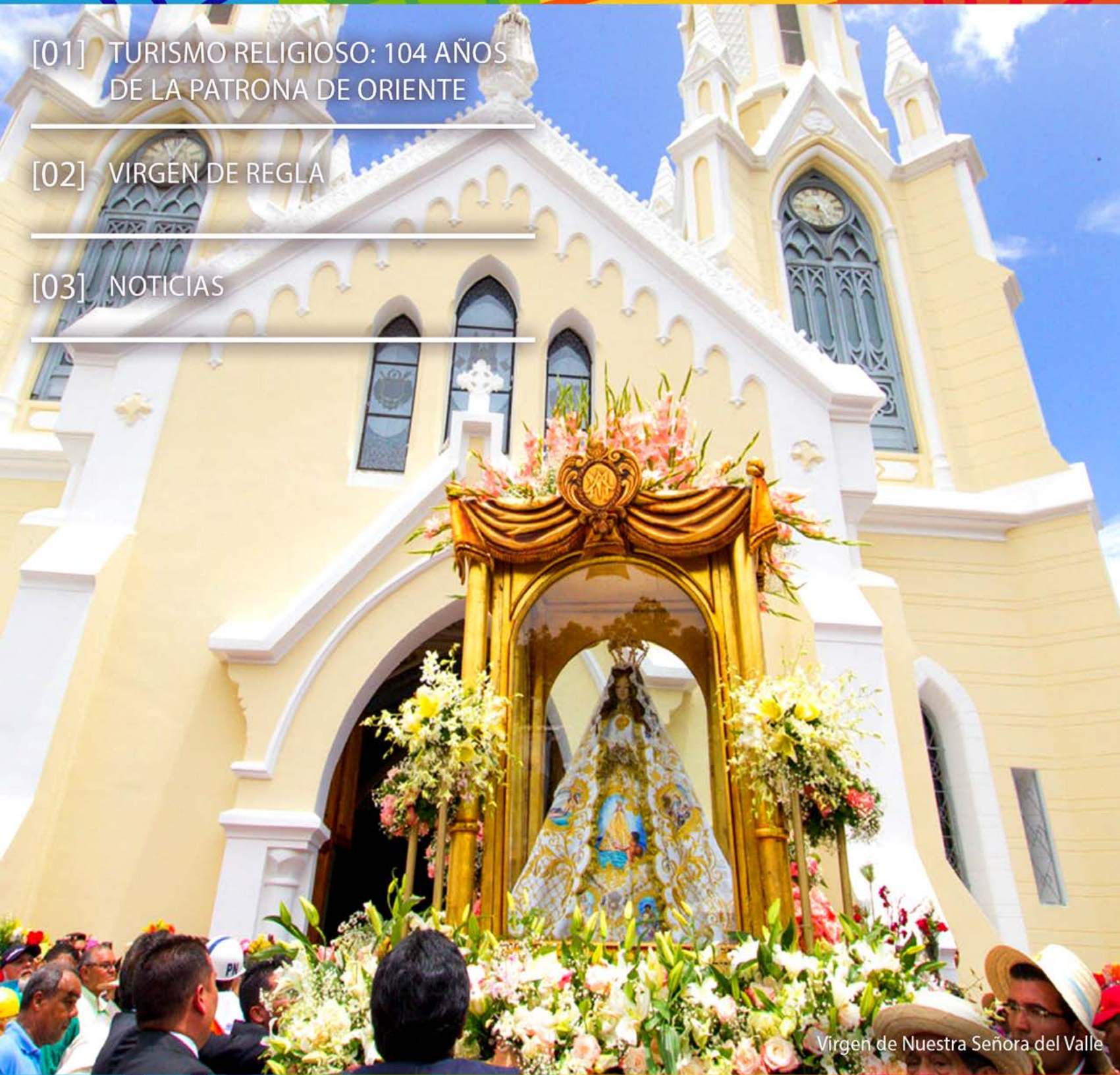
Virgen de Nuestra Señora del Valle