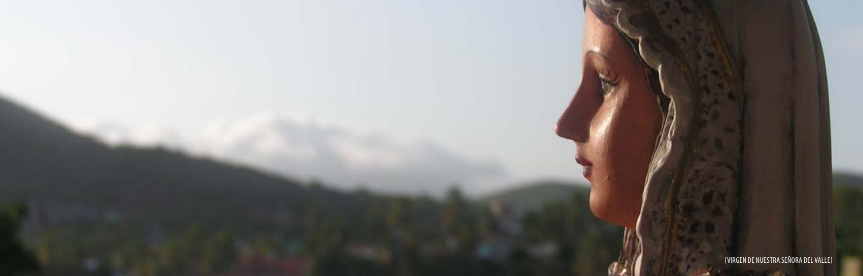
[VIRGEN DE NUESTRA SEÑORA DEL VALLE]