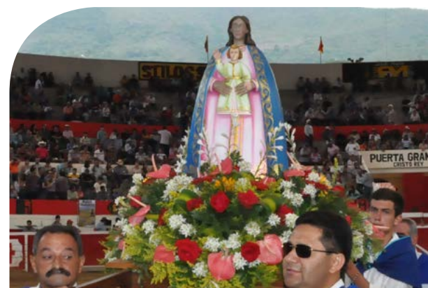
[VIRGEN DE REGLA]

En esta edición profundizamos acerca de la Virgen del Valle y la procesión de la Virgen de Regla, una manifestación conocida por pocos, pero de gran importancia para los residentes del pueblo de Tovar, en el estado Mérida.