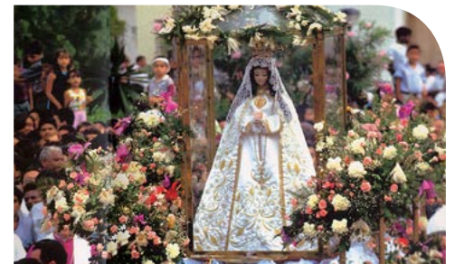
[VIRGEN DE NUESTRA SEÑORA DEL VALLE]

E nclavada frente al mar Caribe, específicamente en El Valle del Espíritu Santo de la isla de Margarita, se encuentra la Virgen de Nuestra Señora del Valle. La localidad, aposento del Sacrosanto Relicario de la Imagen, cobija a la patrona del oriente de Venezuela.