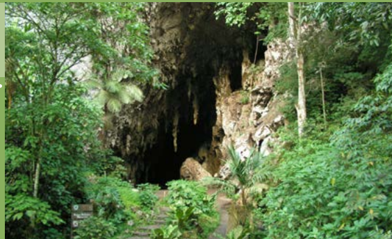
[CUEVA DEL GUÁCHARO]

E l Monumento Natural Alejandro de Humboldt, mejor conocido como Cueva del Guácharo, cumplió 66 años de haber sido declarado como el primer Monumento Natural de Venezuela. La caverna fue dada a conocer mundialmente tras la visita del científico alemán Alejandro de Humboldt, en el año 1799.