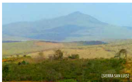
[SIERRA SAN LUIS]