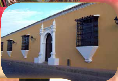
[CORO LA VELA]