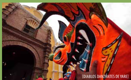
[DIABLOS DANZANTES DE YARE]

El pasado jueves 4 de junio se celebró en 5 entidades del país los Diablos Danzantes de Corpus Christi, manifestación data de mediados de siglo XVIII, integrando expresiones diversas de ritualidad de carácter sagrado y profano. Fue declarada como Patrimonio Cultural Inmaterial de la Humanidad por la Organización de las Naciones Unidas (Unesco) para la Educación, la Ciencia y la Cultura la Unesco el 6 de diciembre de 2012.