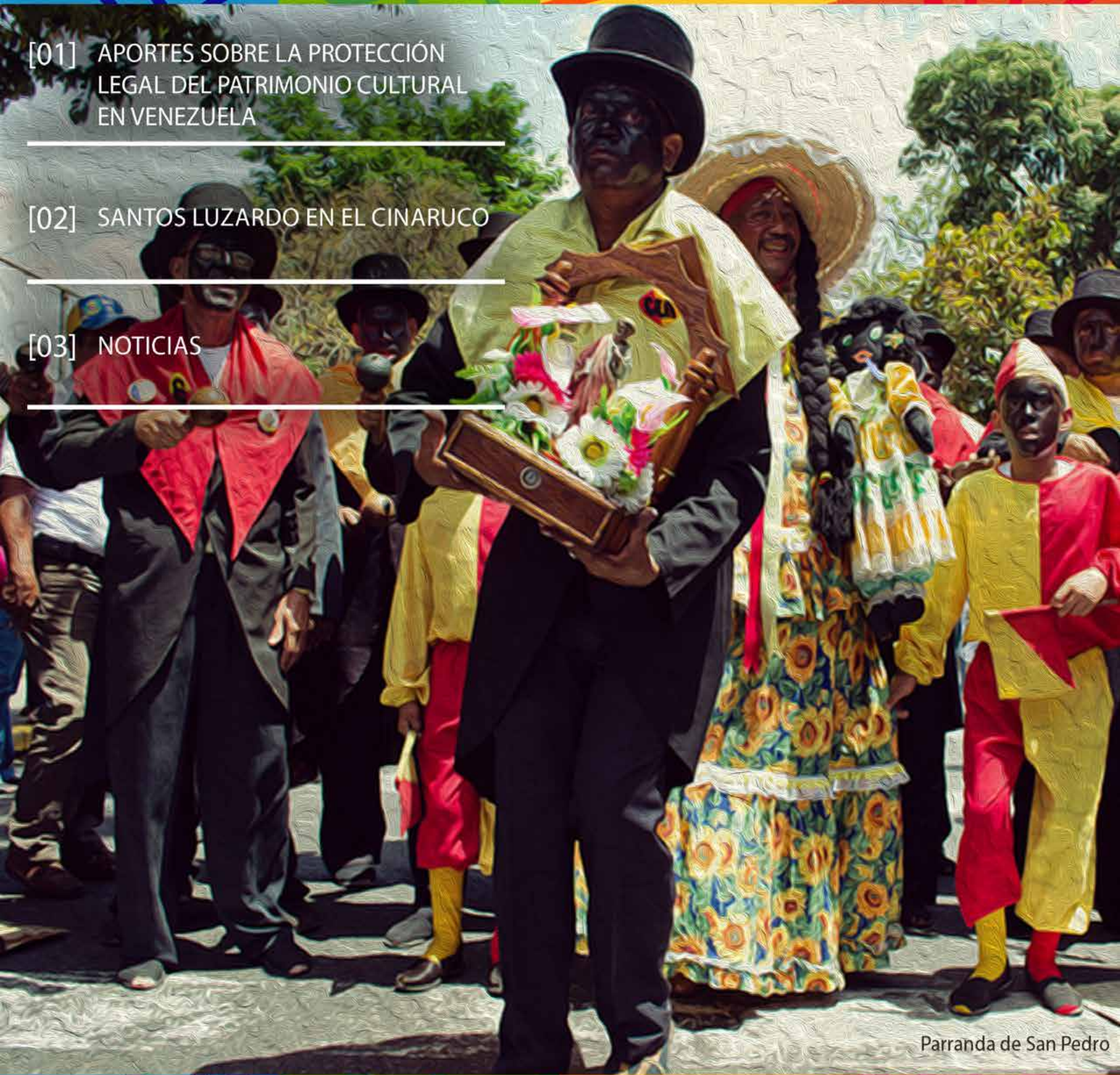
Parranda de San Pedro