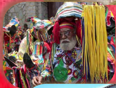
[DIABLOS DANZANTES DE MAGUATA]