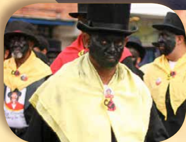
[PARRANDA DE SAN PEDRO]