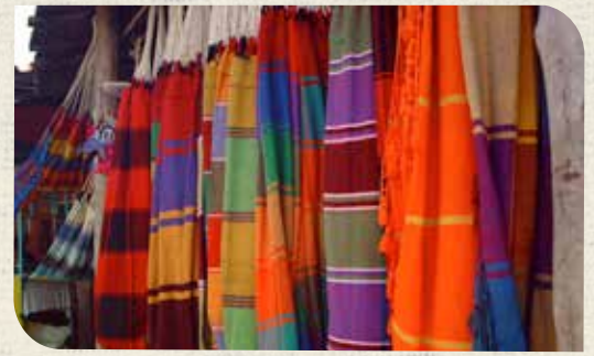
Feria de Artesanía en Tintorero, estado Lara