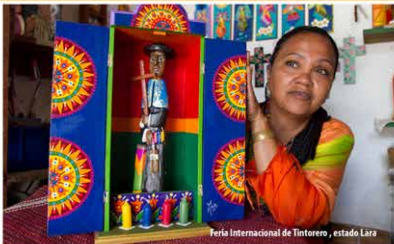
Feria Internacional de Tintorero, estado Lara

MINTUR: apoyando el fortalecimiento del turismo cultural.