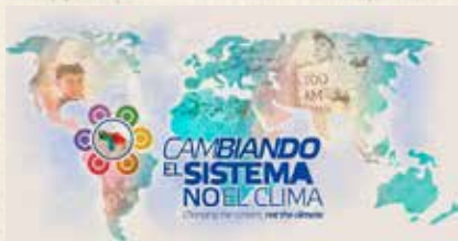
Cumbre de la PRECOP