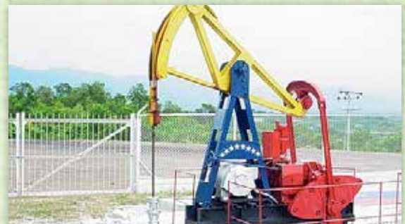
Ubicado en el municipio Baralt del estado Zulia, a pocos Km del Lago de Maracaibo.

EN EL ESTADO ZULIA SE PUEDE EVIDENCIAR OTRA MODALIDAD DEL TURISMO INDUSTRIAL, EL CUAL SE TRATA DEL ZUMAQUE 1, EL PRIMER POZO PETROLERO QUE DIÓ INICIO A LA EXPLOTACIÓN DEL CAMPO MENE GRANDE EN EL AÑO 1914.