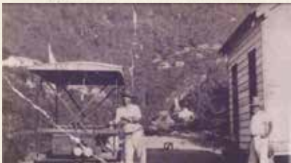
Minas de Aroa