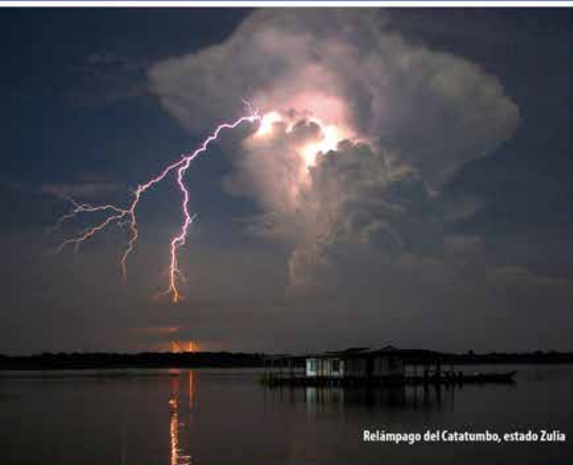
Relámpago del Catatumbo, estado Zulia

16 de septiembre, "Día Mundial de la Capa de Ozono"