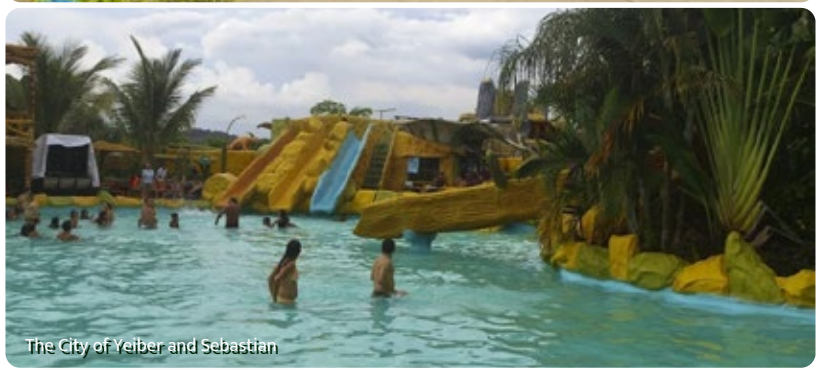
The City of Yeiber and Sebastian