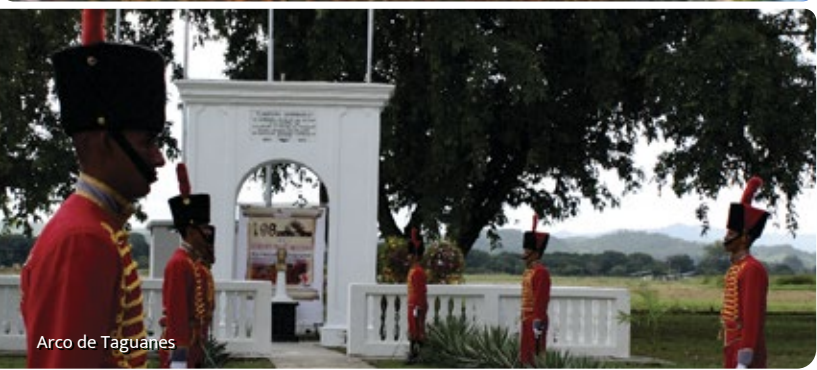
Arco de Taguanes