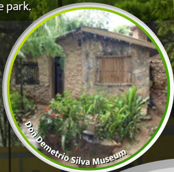
Don Demetrio Silva Museum