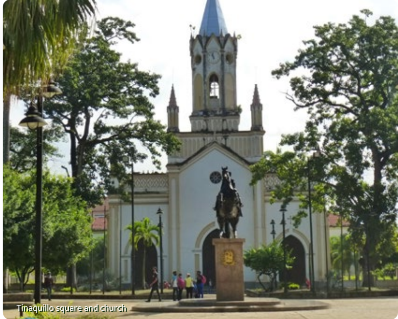
Tinaquillo square and church