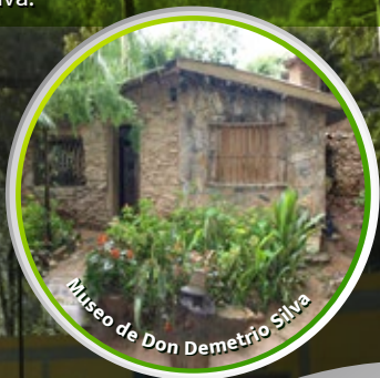
Museo de Don Demetrio Silva